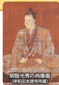
明智光秀の肖像画 (岸和田本徳寺所蔵)