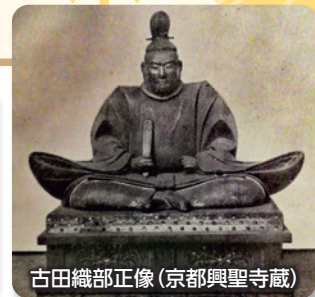
古田織部正像(京都興聖寺蔵)